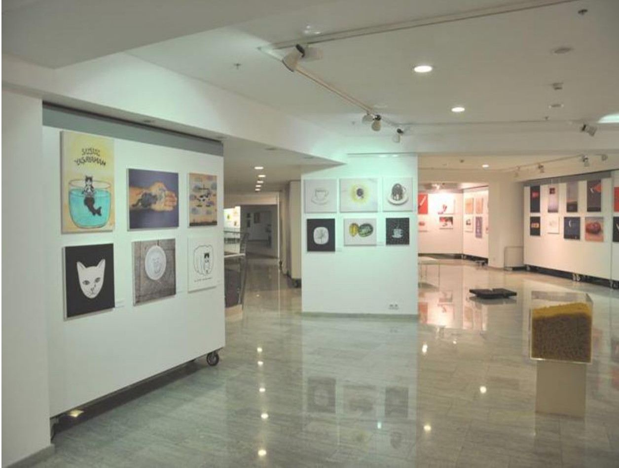
Caddebostan Kültür Merkezi

PAS: Okuyucularımız için en son serginizi tanıtır mısınız? Koleksiyonunuzun başlığı nedir ve içinde kaç adet sanat eseriniz yer alıyor? Ayrıca biraz kendiniz ve koleksiyonunuzu bir araya getirmenizin ne kadar sürdüğü konusunda da bilgi verebilir misiniz?